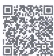
คู่มือประชาชน การเลือกตั้งเทศบาล