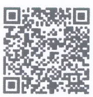
ใบสมัครรับเลือกตั้ง ส.ถ./พ.ถ. 4/1

ทั้งนี้ สามารถศึกษารายละเอียดเพิ่มเติมได้จากพระราชบัญญัติการเลือกตั้งสมาชิกสภาท้องถิ่นหรือผู้บริหารท้องถิ่น พ.ศ. 2562 แก้ไขเพิ่มเติม (ฉบับที่ 2) พ.ศ. 2566 พระราชบัญญัติเทศบาล พ.ศ.2496 (แก้ไขเพิ่มเติมถึงฉบับที่ 14) พ.ศ.2562 หรือทางเว็บไซต์สำนักงานคณะกรรมการการเลือกตั้ง www.ect.go.th และสามารถขอทราบรายละเอียดเพิ่มเติมได้ที่สำนักงานเทศบาลหรือสำนักงานคณะกรรมการการเลือกตั้งประจำจังหวัดทุกจังหวัด หรือบริการสายด่วน 1444 หรือ Application Smart Vote